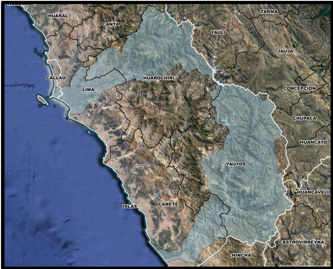
Mapa de zonas afectadas

Provincias: LIMA, HUARACHIRÍ, YAUYOS Y CAÑETE